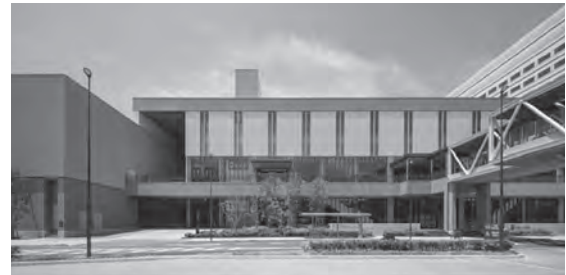
▲出島メッセ長崎(長崎市)