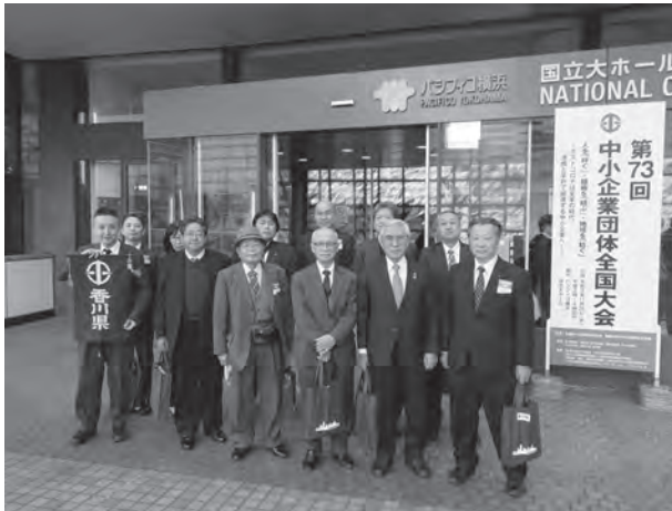
▲昨年度全国大会参加者

傘下の組合員の皆様にもご周知いただきまして、ぜひご参加下さいますようお願い申し上げます。