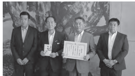
▲浜田知事と寄贈を行った組合役員