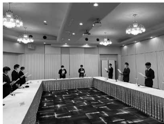
▲四国ブロック会長会議での行動指針唱和