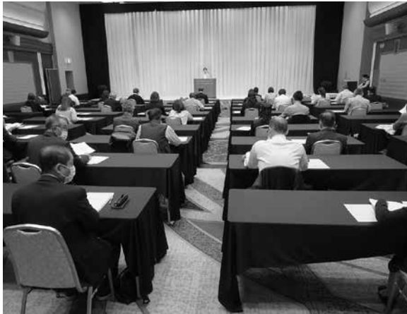
▲会場の様子(感染症対策に配慮して開催)

本会事業振興部・元家係長より「組合事務局代表者が知っておくべき実務のポイント」をテーマに、決算期の事務手順や事業報告書、決算関係書類の作成、各種登記手続きや組合法に対応した事務処理、行政庁に提出する書類等、実務面を中心に説明を行いました。