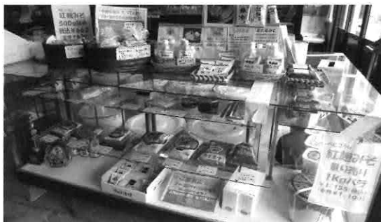
▲中屋醸造所・店頭