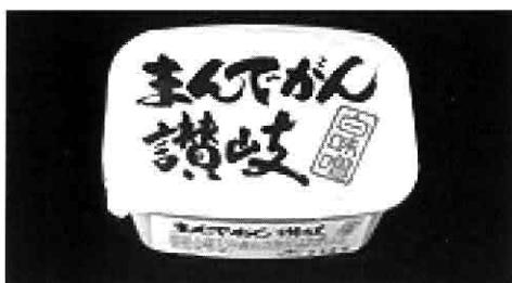
▲『まんできん讃岐白味噌』

中屋醸造所の一番人気「白みそ」の中でも、『まんできん讃岐白味噌』は、米・大豆・食塩、そして作り手、まんできん(すべて)が香川県産の高級みそで、好評を博しています。