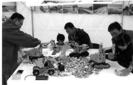
▲お菓子すくいに挑戦