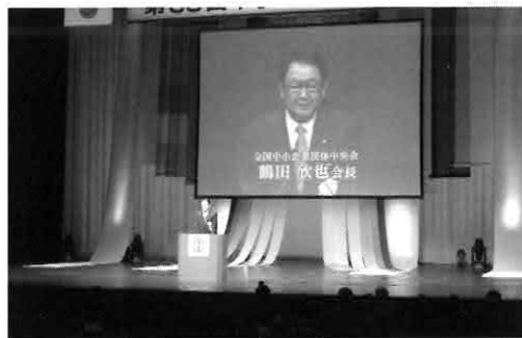
▲大会の様子(芸術劇場びわ湖ホール)