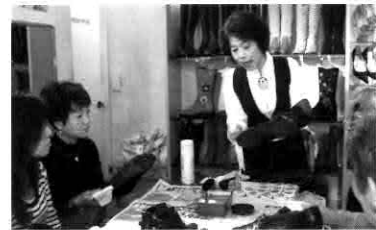
▲ワークショップの様子

組合では、「ワークショップへの参加を通して、もっとライオン通に来街してもらいたい。」と話していました。