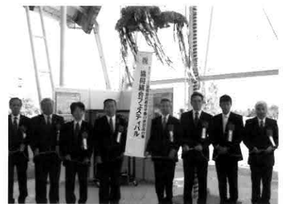
▲くす玉開きの様子