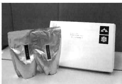
▲その他取扱商品(和三盆糖蜜)