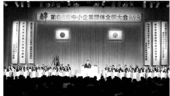
▲大会の様子(シーガイアコンベンションセンター)