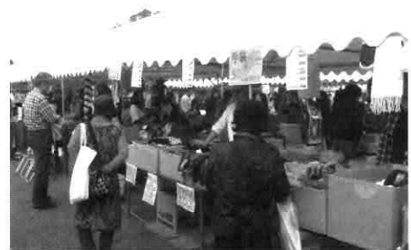
▲昨年の「あいらぶ東かがわ大物産展」の様子