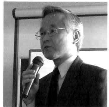
▲講師 岸本企業部相談課課長