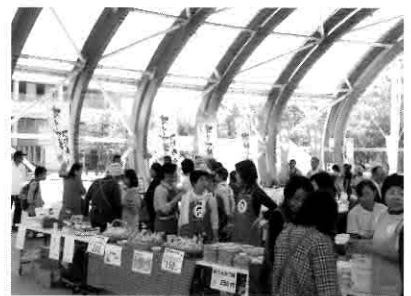
▲販売・展示・体験ブース