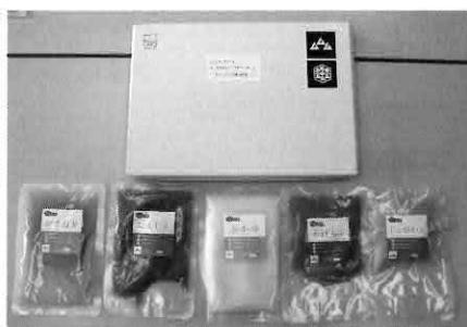
▲ビューレのレトルト

また、一方でムムム農法での生産連携を進め、耕作放棄地の解消や限界集落の活性に役立ちたいと、鳥取県、岡山県の農家とムムム農法のグループ化を進めています。来年還暦を迎えますが、今後、安心安全の食材の提供と農業後継者の育成に取り組んでいきたいと思っています。