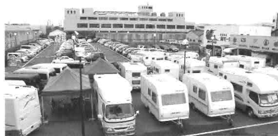
▲キャンピングカー展示場

豊富な知識と経験をもった専門スタッフとメカニックがおりますので何でもご相談頂くことができます。