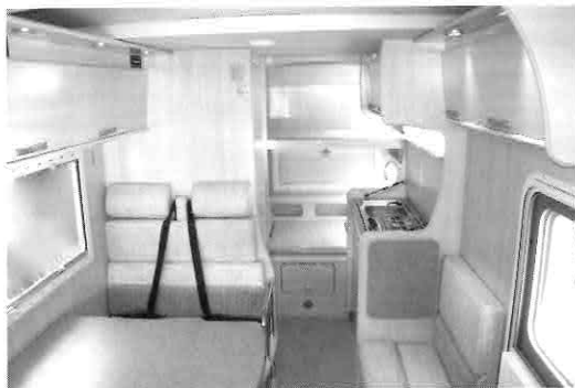
▲キャンピングカーの車内

A 基本的に普通の乗用車を1台所有するのと維持費はほとんど変わりません。自動車税などはむしろ普通車より安く、高速道路も普通車料金で利用できます。