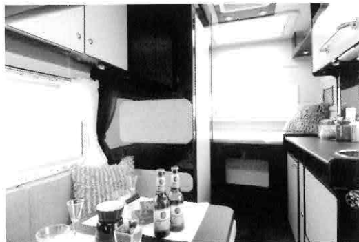
▲コンパクトで実用性も兼ね備えています