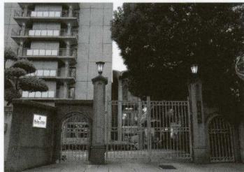
▲東京さぬき倶楽部

【東京さぬき倶楽部】 〒108-0073 東京都港区三田1丁目11番9号 TEL 03-3455-5551 FAX 03-3451-4060