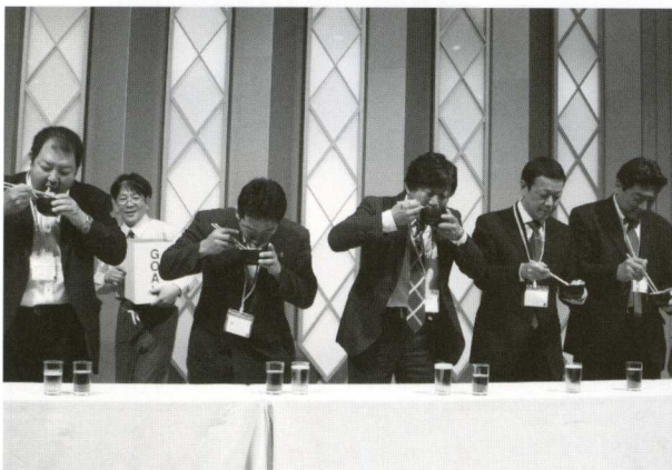
▲懇親会でのうどん早食い競争

総会翌日の6日は、同会場にて全国代表者会議が開催されました。ディスカッション形式によって進行が行われ、各都道府県の代表者が「青年中央会のメリットとデメリット」を基本テーマに、大いに議論が交わされました。