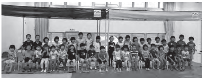
◀寄贈されたテントと寄贈式の様子