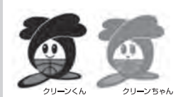
ごみ減量化・リサイクル 推進キャラクター クリーンくん、クリーンちゃん