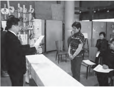
▲ニュー・マイスター認定式