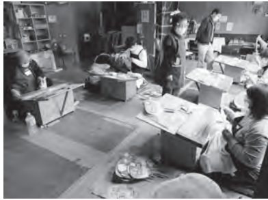
▲丸亀うちわ技術・技法講座ではニュー・マイスターが講師を務める

住所：〒763-0042 香川県丸亀市港町307番地15 電話番号：0877-24-7055 URL https://marugameuchiwa.jp/ 設立：昭和41年12月 出資金：750千円 主な業種：団扇の製造又は販売を行う事業者 組合員数：3会員(所属員25人)