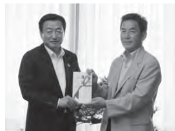
▲寄贈を行う大西理事長(右)